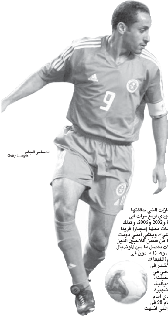
سامي الجابر